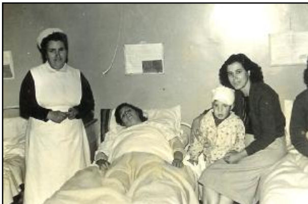
17. Θάλαμος ασθενών του Δημοτικού Νοσοκομείου στις αρχές της δεκαετίας του 1950.