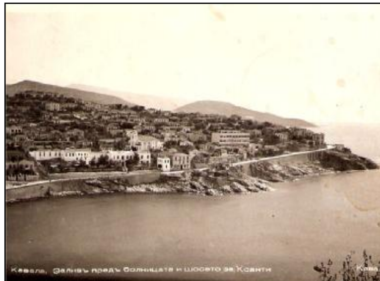
4. Το Δημοτικό νοσοκομείο «Ευαγγελισμός», στη συνοικία της Αγίας Βαρβάρας κατά την περίοδο της κατοχής 1941- 1944.