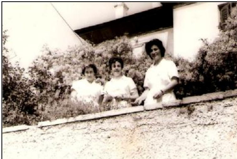
10. Το κτίριο του μαιευτηρίου στην οδό Κολοκοτρώνη με μαίες του ιδρύματος.