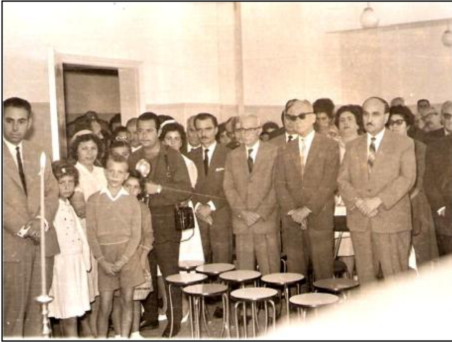
11. Στιγμιότυπο από την τελετή των εγκαινίων στις 6 Οκτωβρίου 1963.