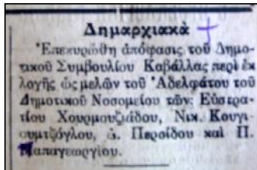
12. Απόκομμα από την εφημερίδα Κήρυξ με ημερομηνία 2 Απριλίου 1927.