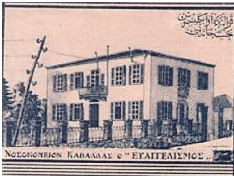
1. Το κτίριο του νοσοκομείου της ελληνορθόδοξης κοινότητας Καβάλας στην οδό 7 ης Μεραρχίας.