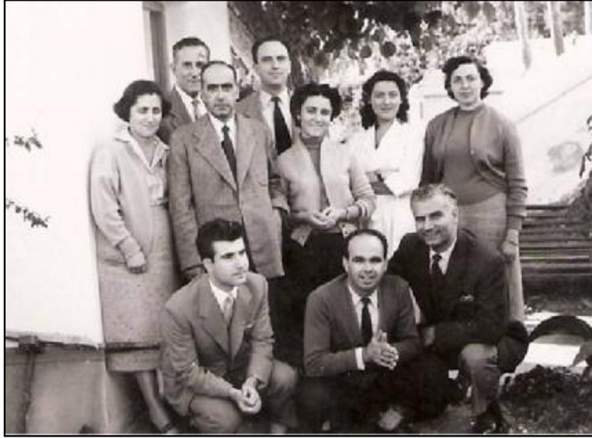
23. Στελέχη του νοσοκομείου στην αυλή του παλαιού κτιρίου.