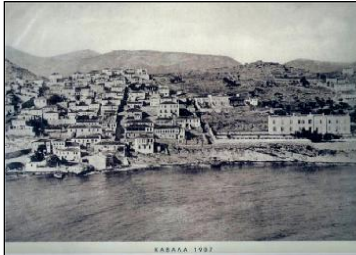
3. Το Διεθνές νοσοκομείο της μουσουλμανικής κοινότητας Καβάλας κατά το 1907.