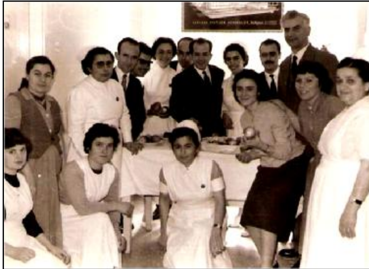
25. Διοικητικό και νοσηλευτικό προσωπικό του Νοσοκομείου.