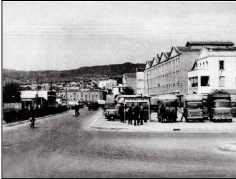
9. Στο δεξί μέρος της φωτογραφίας, το λευκό κτίριο στο οποίο στεγάστηκε η μαιευτική κλινική του Δημοτικού Νοσοκομείου το 1947. Από το βιβλίο της Σ. Αγγελούδη «Η Καβάλα άλλοτε και τώρα».