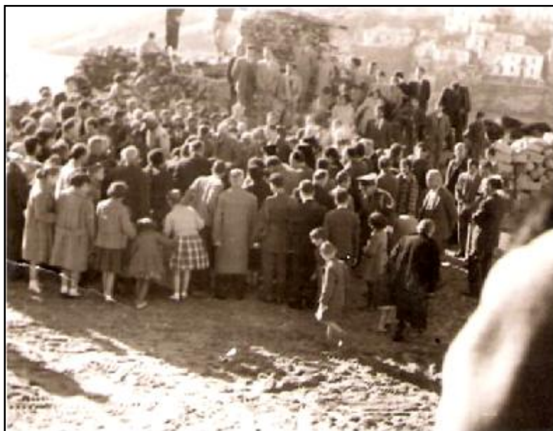
6. Η θεμελίωση του νέου κτιρίου του νοσοκομείου από τον μητροπολίτη Χρυσόστομο την Πρωτοχρονιά του 1960.