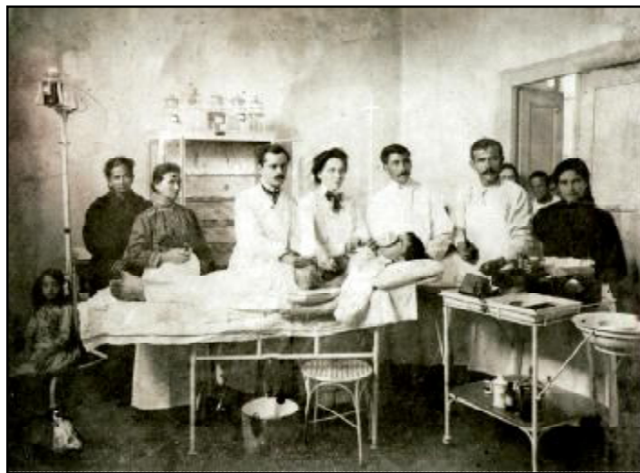
2. Το χειρουργείο του νοσοκομείου Ευαγγελισμός περίπου στα 1910.