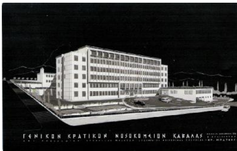
5. Η μακέτα του νέου Γενικού Κρατικού Νοσοκομείου Καβάλας.